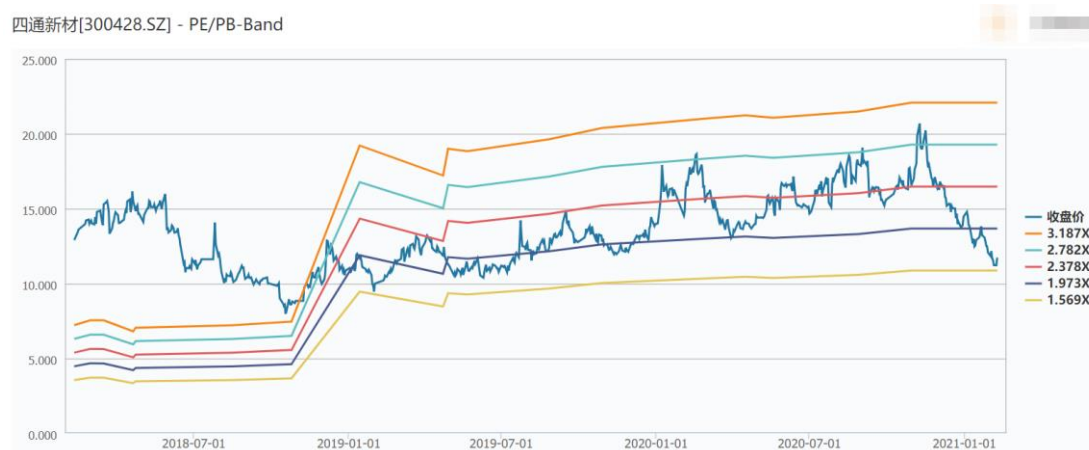
（四通新材市净率走势；数据来源：Wind）

另一方面，四通新材作为汽车产业链上游赛道的参与者，其估值也有望在行业整体估值抬升的情况下迎来修复。四通新材最新的市净率仅为 1.7 倍，仍然处于历史估值的底部区间，具有较高的安全边际。目前整车制造龙头企业普遍享受高估值，未来随着时间的推移，高估值亦有望传导至汽车零部件的龙头企业。